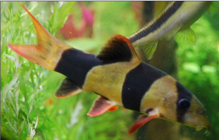
Eén van mijn twee clownbotia's. Foto genomen begin september 2014

En ik die dacht dat mijn clownbotia's ( Chromobotia macracanthus ), gekocht op 24/11/84, wereldrecordhouders waren. Enfin wat niet is kan nog komen, alleen zal ik en mijn zoon het niet meer meemaken natuurlijk. Zoals ze nu rondzwemmen ziet het er niet naar uit dat ze van plan zijn er het loodje bij neer te leggen. Op 24 november zal er dus heel waarschijnlijk een verjaardagsfeest gehouden worden.