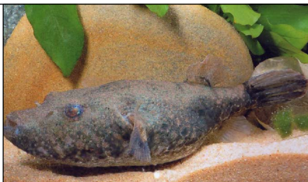
Tetraodon suvattii komt enkel voor in het stroomgebied van de Mekong.

De vis die verantwoordelijk is voor de aanvallen is niet gekend. De lokale bevolking denk dat de piemelbijter een uit een viskwekerij ontsnapte zilverpomfret ( Pampus argenteus , een populaire voedselvis) is.