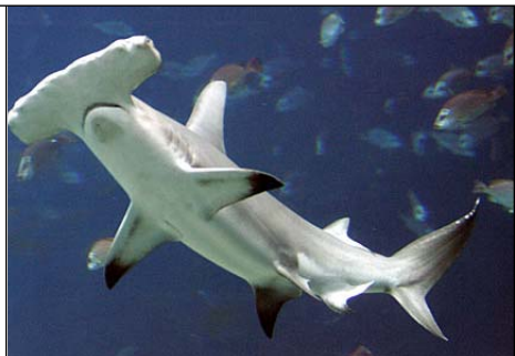
Sphyma zygaena gladde hamerhaai Anchor