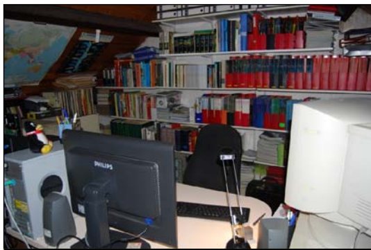
Mijn natuurlijk biotoop

Mijn eerste doelstelling, het tijdschrift vullen met uitsluitend artikels geschreven door eigen leden, werd op een paar uitzonderingen na, nooit gehaald. Nochtans ben ik er nog steeds van overtuigd dat vele leden – ik denk hier dan vooral aan de ietwat oudere mensen – voldoende bagage in huis hebben om een boeiend en leerzaam artikel neer te pennen. Maar ja, artikels schrijven is blijkbaar veel moeilijker dan een mooi aquarium/vijver opbouwen. Ik besef ten volle dat een tekst op papier of op computer zetten niet echt een gemakkelijke klus is. Net zoals je bij het opzetten/onderhouden van een plantenbak fingerspitzengefühl moet hebben – ik heb dit dus niet, maar dat is stof voor een ander verhaal – heb je ook bij het aaneenrijgen van woorden om een zinnig verhaal te vormen een soort vaardigheid nodig. Sommige mensen